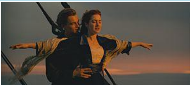
Leonardo DiCaprio e Kate Winslet sulla prua del Titanic